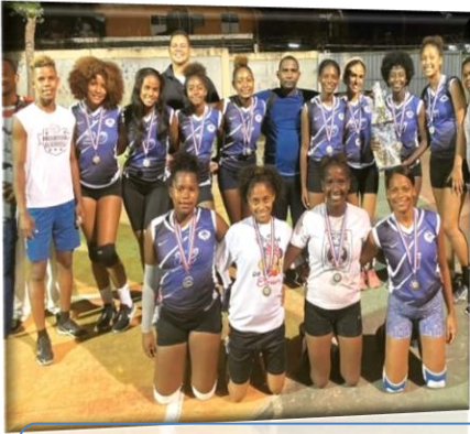
Apoyo económico a Equipo de Vóley Ball