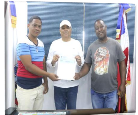
Apoyo económico a Organizadores de actividad culturales