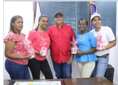
Entrega de Obsequios a Madres