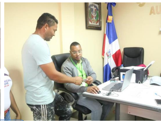
Operativo de Senasa Régimen subsidiario