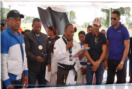
Patrocinio de Torneo Taekwondo