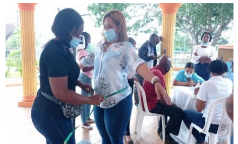
Operativo de Prevención de hipertensión, Diabetes y Obesidad, Área 1 de Salud