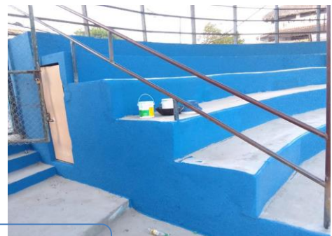
Acondicionamiento Gradas Play de Soft Ball