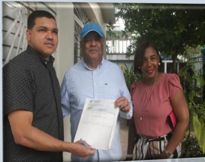
Aporte económico para celebración Patronales San Isidro