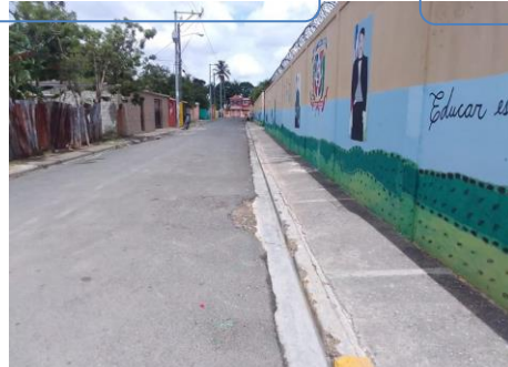
Limpeza de Contenes