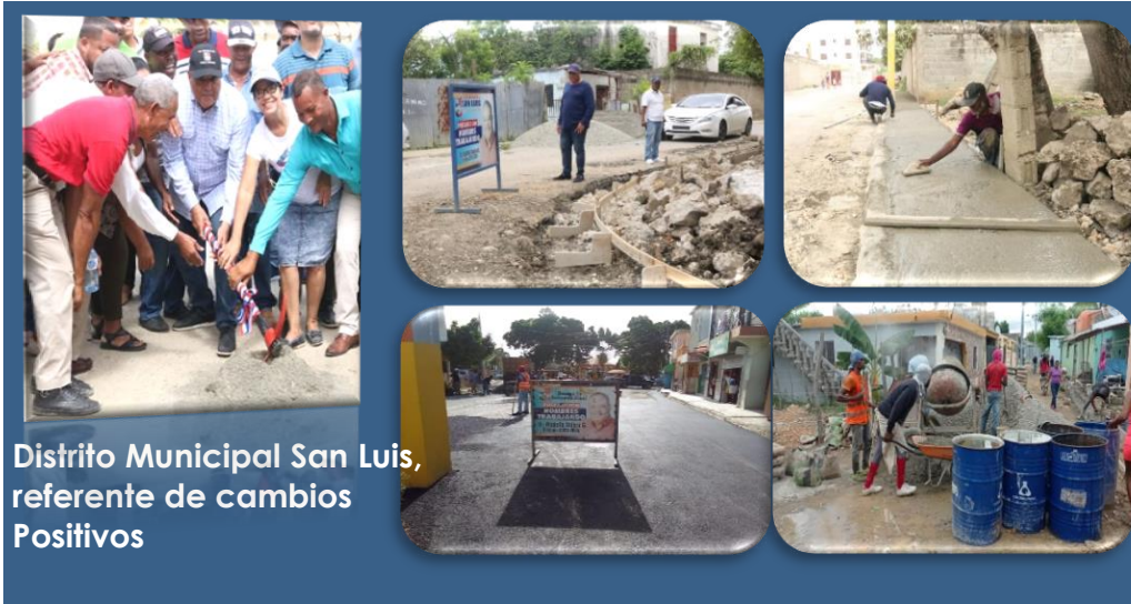
Distrito Municipal San Luis, referente de cambios Positivos